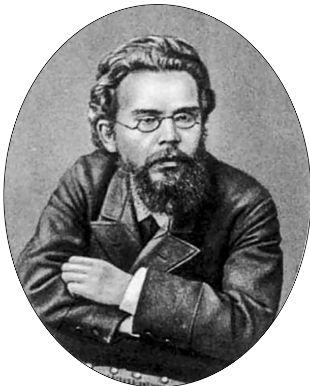
Портрет Ю.Н. Говорухи-Отрока

чием, царящим в терминологии. В первую очередь, здесь нельзя не сказать о том, что критика и наука о литературе являются обособленными сферами, которые вместе с тем не могут полноценно существовать друг без друга. В то же время вопрос о строгом разделении двух сфер остается предметом дискуссий на протяжении нескольких десятилетий.